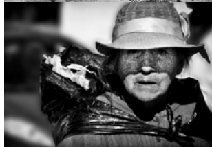
Foto No. 197 “La última pitada” de Nicolás Javier Schiapparelli Argentina

Foto No. 190 “Inocencia” de Paola Marques Sangiorgi Argentina